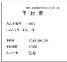
幅 80 mm