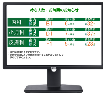
受付で予約システムを使用するパソコンに外付けモニターを1台接続して利用します

院内にディスプレイを設置し、患者さんに現在の待ち人数や待ち時間を表示させることができます。ネットから順番待ちができない患者さんも、おおよその待ち時間がわかるのでイライラの解消に効果があります。