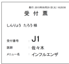
幅 80 mm